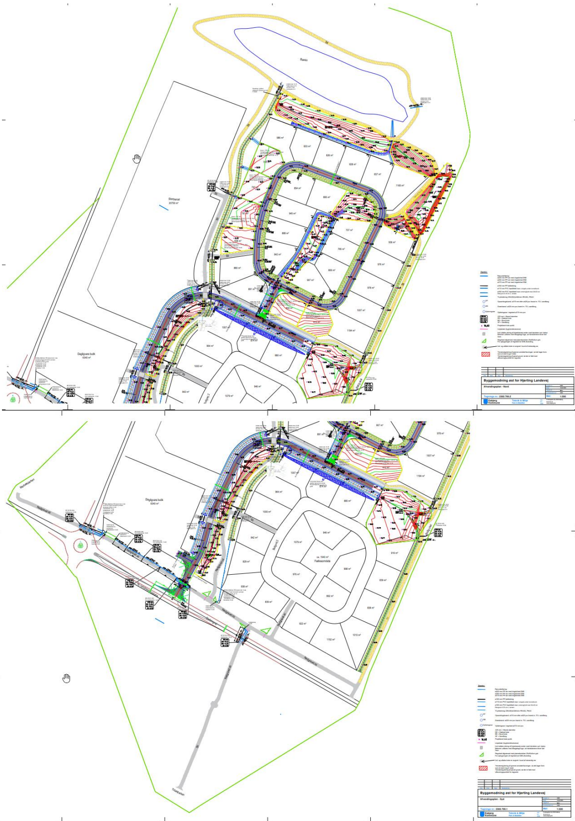
Figur 1.1 Afvandingsplan, planlagt byggemodning nord og syd. Se bilag 3.

Rambøll - Kontrakt i henhold til omkostningsbekendtgørelse